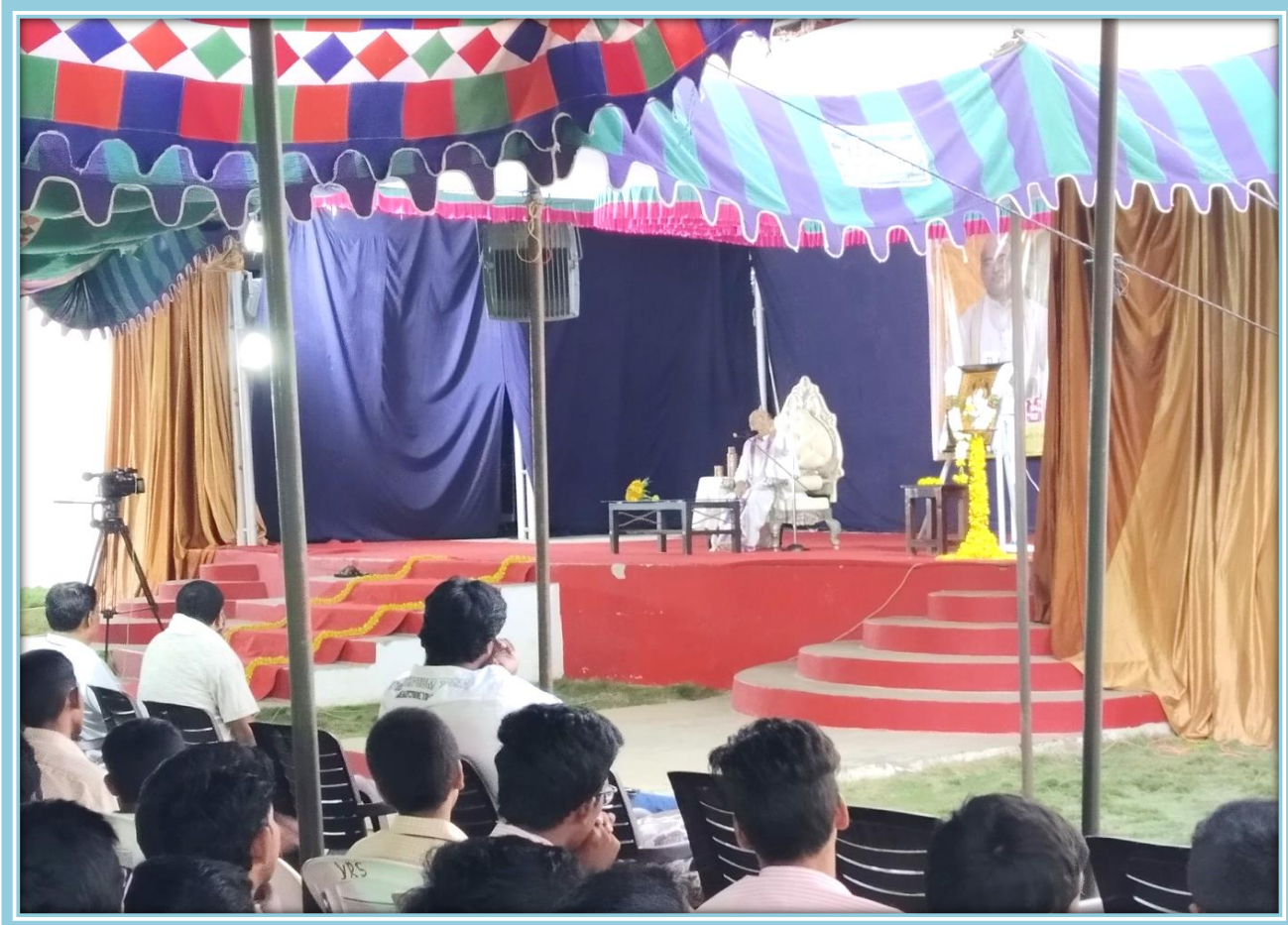
DAY - II- 18/10/2019