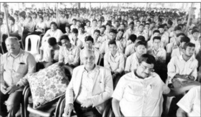
కార్యక్రమానికి హాజరైన అధ్యాపకులు, విద్యార్థులు