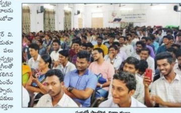
సభలో పాల్గొన్న విద్యార్థులు

Sun, 20 October 2019 https://epaper.prabhames.com/c/44872729