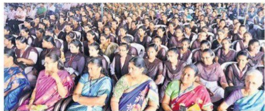
మాట్లాడుతున్న ప్రవచనకర్త డాక్టర్ గరికపాటి నరసింహారావు, హోబైన్ విద్యార్థులు

కావన్నారు. విద్య పరమార్థాన్ని గ్రహిస్తే చక్కని జీవితాన్ని సొంతం చేసుకోవచ్చన్నారు. దర్భణధంగా జీవితాన్ని కొనసాగించే వారికి అంతా ఆనందమయంగానే ఉంటుందన్నారు. ఎదుటివారిని మెప్పించటమే కమ్యూనికేషన్ స్కిల్ అన్నారు. అందరినీ ఆకట్టుకునే మాటలు చెప్పగలిగే సామర్థ్యాన్ని