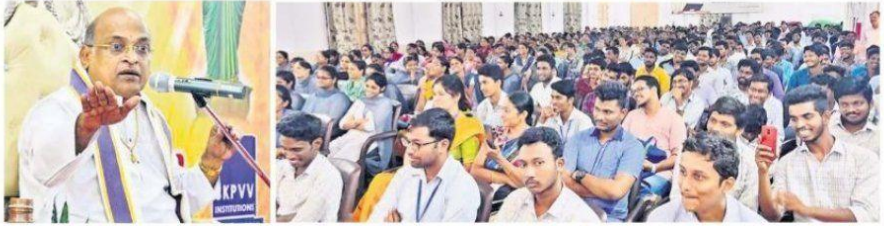
మాట్లాడుతున్న గరికపాటి, హాజరైన విద్యార్థిని విద్యార్థులు